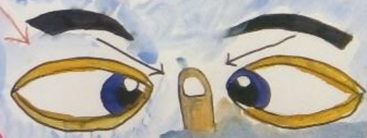
СВЕДЕНИЕ ГЛАЗ К НОСУ. ДЛЯ ЭТОГО К ПЕРЕНОСИЦЕ ПОДНЕСИТЕ ПАЛЬЦ И ПОСМОТРИТЕ НА НЕГО.