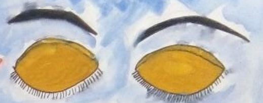
ЧАСТОЕ МОРГАНИЕ ГЛАЗАМИ