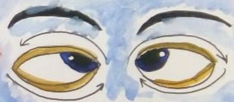
ВРАЩЕНИЕ ГЛАЗ ПО КРУГУ; ВРАЩЕНИЕ ГЛАЗНЫХ ЯБЛОК ВВЕРХ, ВНИЗ.